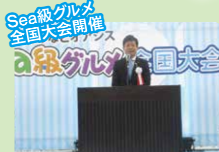
Sea級グルメ全国大会開催