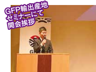
GFP輸出産地セミナーにて開会挨拶

世界文化遺産の富士山、世界ジオパーク伊豆半島を有し、「水わさび」の伝統的な栽培方法は世界農業遺産に認定されています。豊かな大地と清らかな水に育まれたワサビやキンメダイ、西伊豆の潮かつお、みかん、しいたけ等の多彩な食材による郷土料理、豊かな景観、地域の伝統や歴史等を体感できる旅を提供していきます。 また、私が先頭に立って約9年かけて誘致活動を行った「Sea級グルメ全国大会」が沼津市制100周年記念行事として開催されました。当日は晴天にも恵まれ、全国から過去最多約12万5千人の皆さまに来場いただき、全国のみならずオアシスの海鮮を求め沼津港が賑わいました。 今後とも沼津港のさらなる発展と、水産業振興を図っていきます!