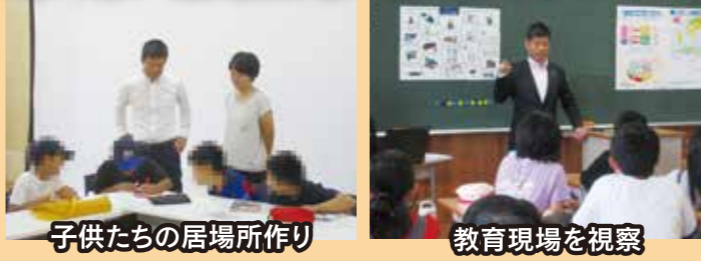
子供たちの居場所作り、教育現場を視察

子供たちの教育環境の改善に向け、引き続き現場に赴き、寄り添った活動をしていきます。