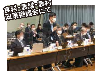
食料・農業・農村政策審議会にて