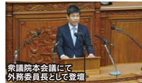
衆議院本会議にて外務委員長として登壇