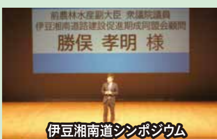
伊豆湘南道シンポジウム

静岡県・神奈川県の間が連携し、大動脈である東名・新東名のネットワークを補完強化する高規格道路として期待されています。能登半島地震を受け、伊豆半島における高規格道路などインフラ整備は必要不可欠であり、伊豆半島の玄関口である熱海市の同道路の早期完成に向け、皆さまとともに取り組んでいます。