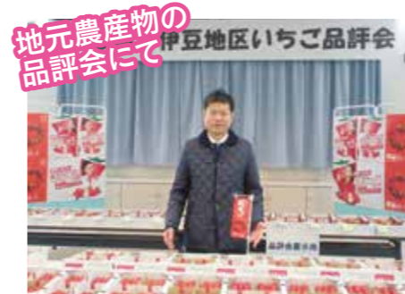
地元農産物の品評会にて伊豆地区いちご品評会