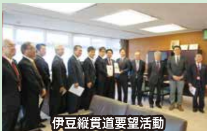
伊豆縦貫道要望活動

伊豆半島は急峻な地形であり工事が難しい箇所も多いため、南海トラフ地震が懸念される中、伊豆半島の「命の道」伊豆縦貫道の予算の更なる確保に向け、皆さまと一緒に全力で頑張っております。