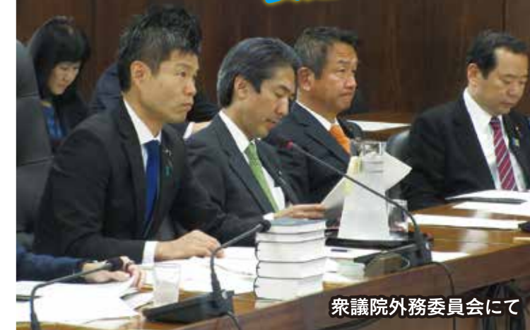
衆議院外務委員会にて

国際情勢の変化は我が国の経済にも大きな影響を及ぼしています。エネルギー、建材、肥料、飼料、農業などの高騰により、多くの産業がコスト高に瀕している状況の中、我が国の国際競争力を高めていくための外交力の強化が必要であります。 国際秩序の平和と安定が強く求められている中で、我が国の果たす役割は国民の生命と財産を守るため、危機管理の徹底及び毅然とした姿勢で外交・安全保障に臨んでまいります。 また、衆議院外務委員長として、各国の議員や使節団の皆さま等と交流をさせていただき、国家間の関係を築いております。