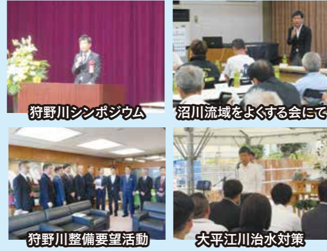
狩野川シンポジウム、沼川流域をよくする会にて、狩野川整備要望活動、大平江川治水対策

南海トラフ地震の発生が懸念されている中で、皆さまの生命と財産を守るべく、一層のインフラ整備を進めてまいります。近年の多発する線状降水帯、台風の大規模化が全国的に多発する中で、狩野川治水事業は非常に重要です。また、沼津市の沼川流域や大平地区をはじめ、豪雨被害を受ける沼津・駿東・伊豆半島全域の各地元の皆さまから多くの切実なご相談をお受けし、丁寧な改善に向けた活動をしております。流域市町と連携し、先頭に立つふるさとを守ってまいります。