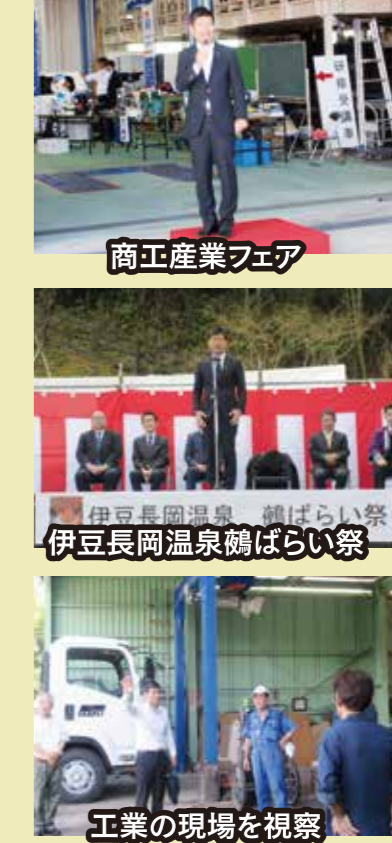
商工業フェア、伊豆長岡温泉 鶴ばらい祭、工業の現場を視察